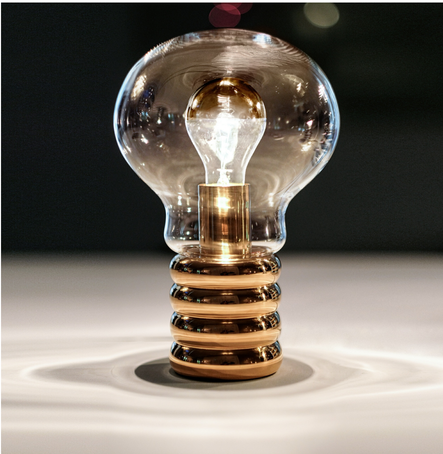
Bulb Brass INGO MAURER TEAM 2021

Messingsockel, mundgeblasenes Kristallglas aus Murano. Bulb Brass ist das neue Mitglied der Ingo Maurer Bulb-Familie. Basierend auf dem weltbekannten Entwurf von 1966 entwickelte das Team Ingo Maurer eine Version aus Messing. Der in Handarbeit gefertigte Leuchtenfuß wird aus hochwertigem Messing angefertigt. Die unbehandelte Oberfläche aus Messing neigt dazu, sich im Laufe der Zeit zu verändern und erhält dadurch einen besonderen Charakter. Es entsteht eine Patina, eine durch natürliche Alterung entstandene Oberfläche. Patina ist ein Ergebnis täglichen Gebrauchs und wird als ästhetischer Zugewinn empfunden, steht sie doch für eine charakteristische Materialeigenschaft, die letztlich als individuelle Handschrift der Benutzer*in verstanden werden kann.