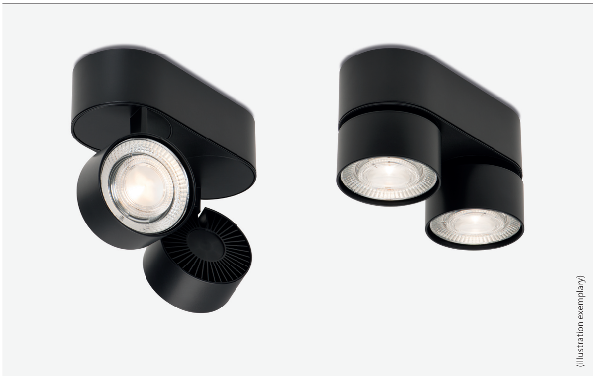
Design: Jan Dinnebier, mawa / Engineering: mawa

* Luminaire series suitable for both private use and sophisticated specialized applications