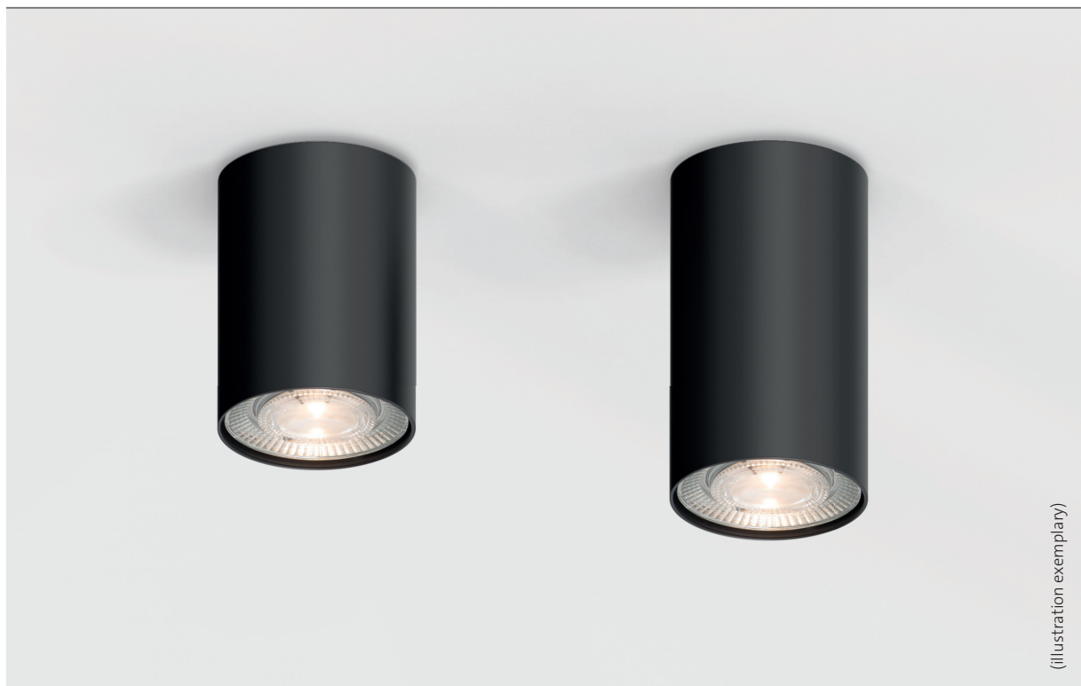
Design: Martin Wallroth / Engineering: mawa

* Luminaire series suitable for both private use and sophisticated specialized applications