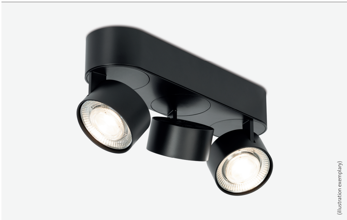
Design: Jan Dinnebier, mawa / Engineering: mawa

* Luminaire series suitable for both private use and sophisticated specialized applications